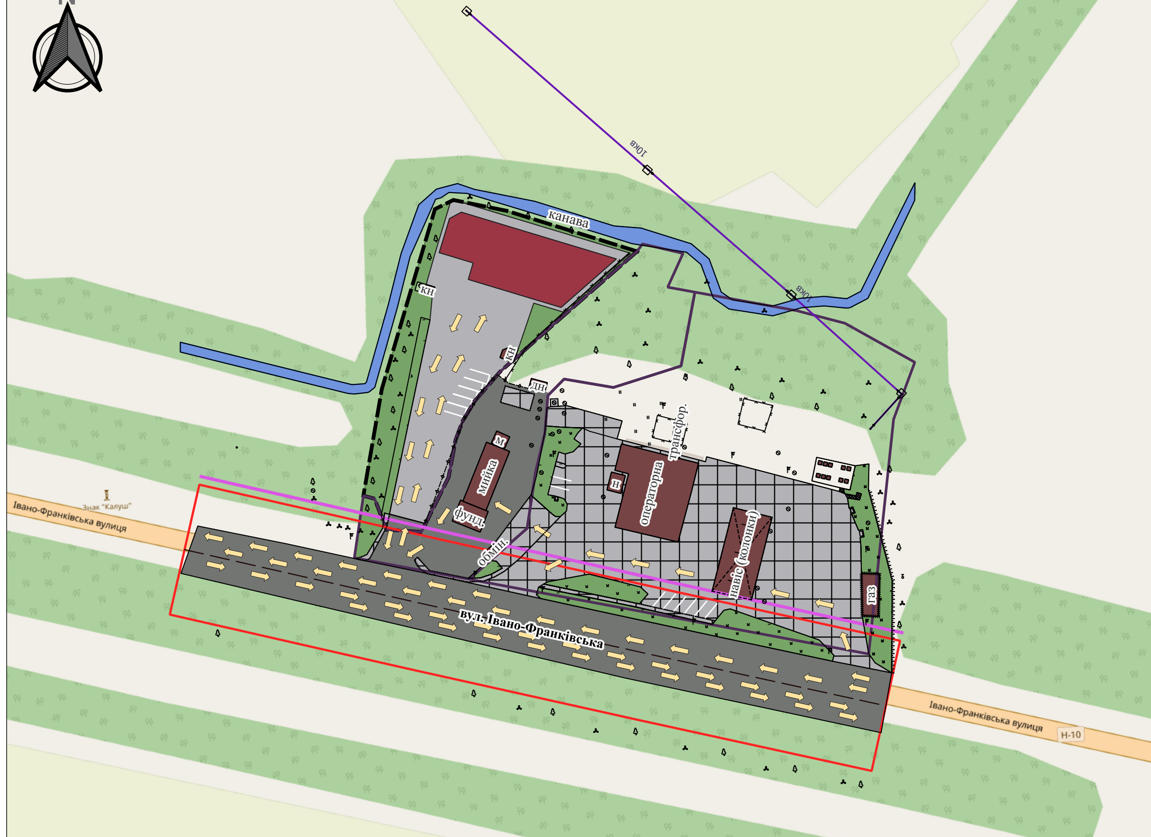
Вул. Івано-Франківська М 1:500