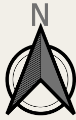
Схема транспортної мобільності та інфраструктури М 1:1000